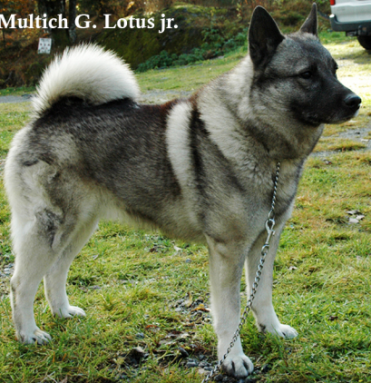
Multich G. Lotus jr.