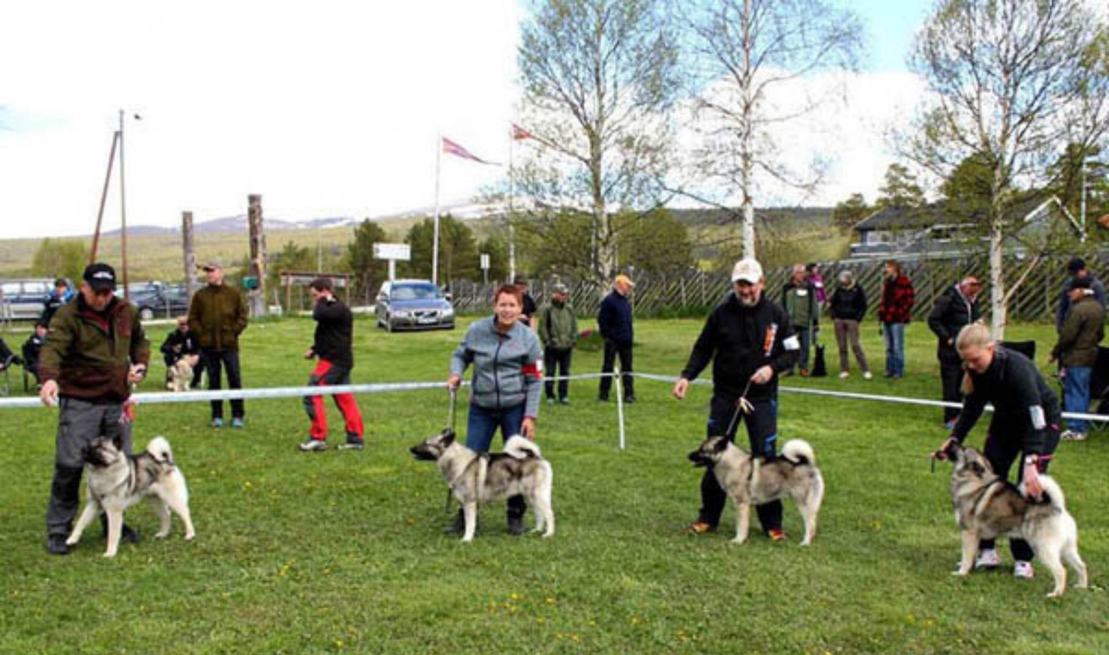
CH-klasse og Beste hannhundklasse 14.6.15 Dombås