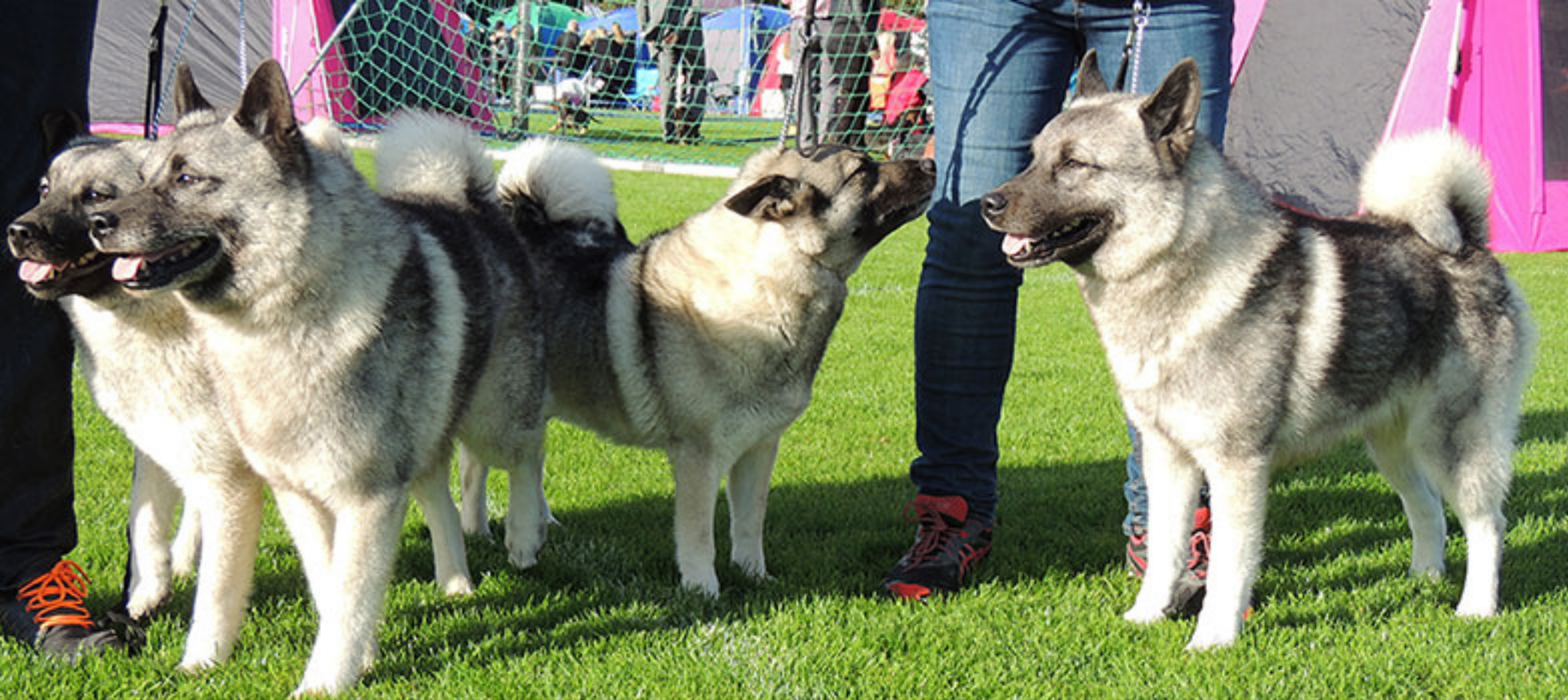
HP Oppdretterklasse Gokstadhaugen Kennel NKK Orre 26.9.15 med Gokstadhaugen's Lilja 2.beste tise res. Cert res. Cacib, Gokstadhaugen's Ask Cert 2BHK, INT NUCH NJ(B)CH Gokstadhaugen's EEA BIM og INT NUCH NJ(B)CH Gokstadhaugen's Lotus jr. BIR BIG-3 2. beste norske rase