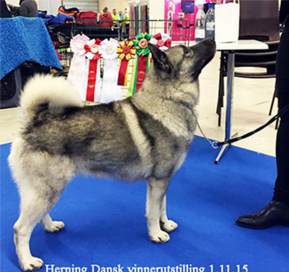
Herning Dansk vinnerutstilling 1.11.15 BIR INT NUCH DKUCH NJ(B)CH DKV-15 Gokstadhaugen's LOTUS JR.