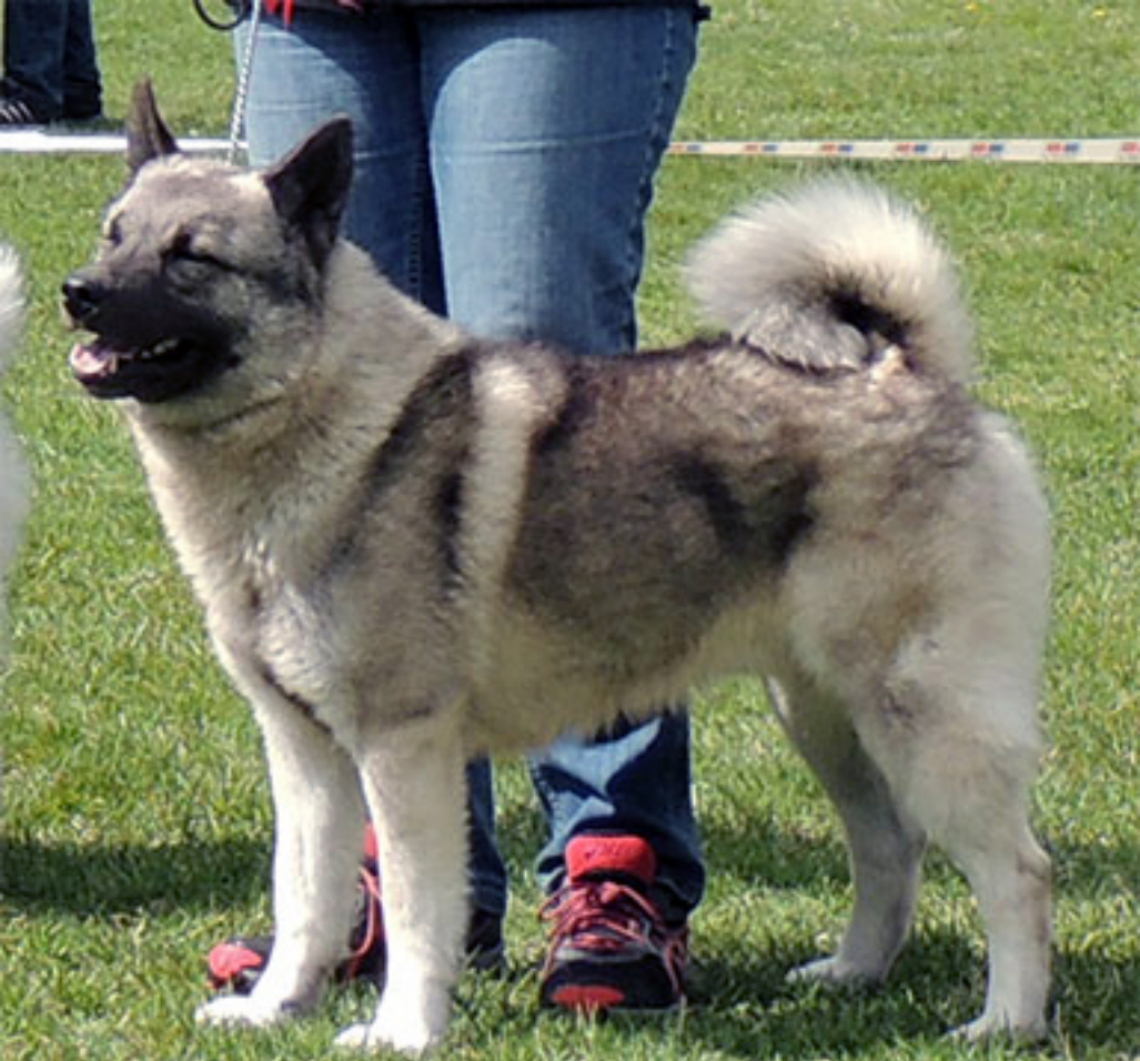
Gokstadhaugen's Lotus Jr CERT BIM